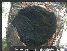
キニヌールを塗布