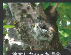
塗布しなかった場合